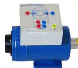
IMMAGINE RAPPRESENTATIVA DELLA GAMMA

Richiedere prezzi a cristiani@cristianisrl.it