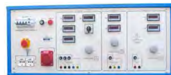
Immagine rappresentativa della gamma

E' disponibile anche: modello carrellato con le medesime caratteristiche tecniche. A richiesta, interfaccia seriale RS-232.