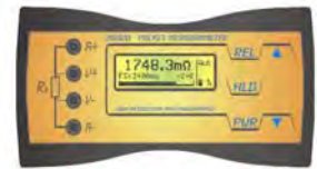
ALIMENTATO A BATTERIA 24000 PUNTI DA 100nΩ A 2400Ω

Richiedere prezzi a cristiani@cristianisrl.it