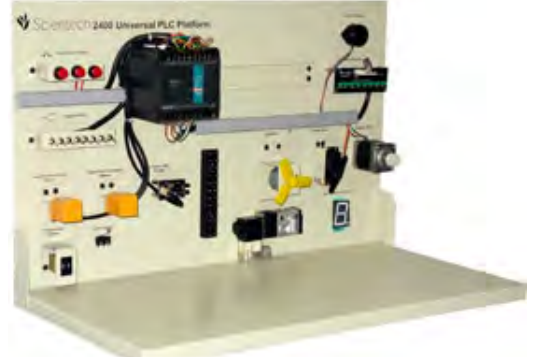
Fotografia indicativa: si riferisce alla configurazione base (qui offerta) integrata da alcune opzioni qui non offerte.

Il PLC Siemens S7 viene fornito completo di software Step7 e cavo di collegamento PLC/PC per la programmazione da parte dell'utente mediante PC.